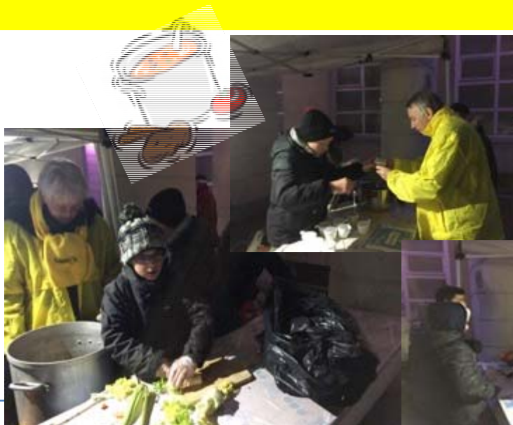
Vente de soupe confectionnée par le CME