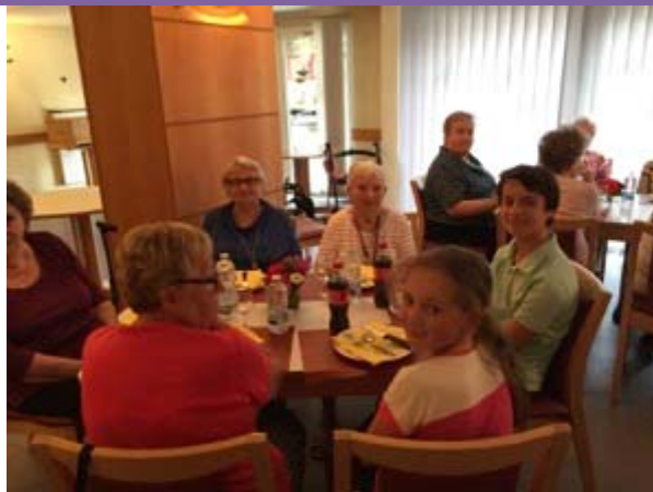
Repas avec les résidents du foyer Autonomie les Fougères.