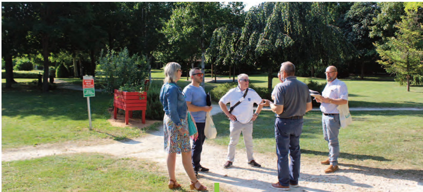
Le parcours proposé au jury comprenait une escale au parc Sainte-Thérèse.

Souvent qualifiée de « ville à la campagne », Ludres s'efforce de laisser une place importante au végétal, pour la préservation de la biodiversité et la valorisation de son patrimoine. Cette volonté politique a, une fois encore, été saluée par le jury régional du label des Villes et Villages Fleuris. Conservant ses « 2 fleurs », Ludres a été récompensée par un Prix spécial régional : le prix de l'action pédagogique.