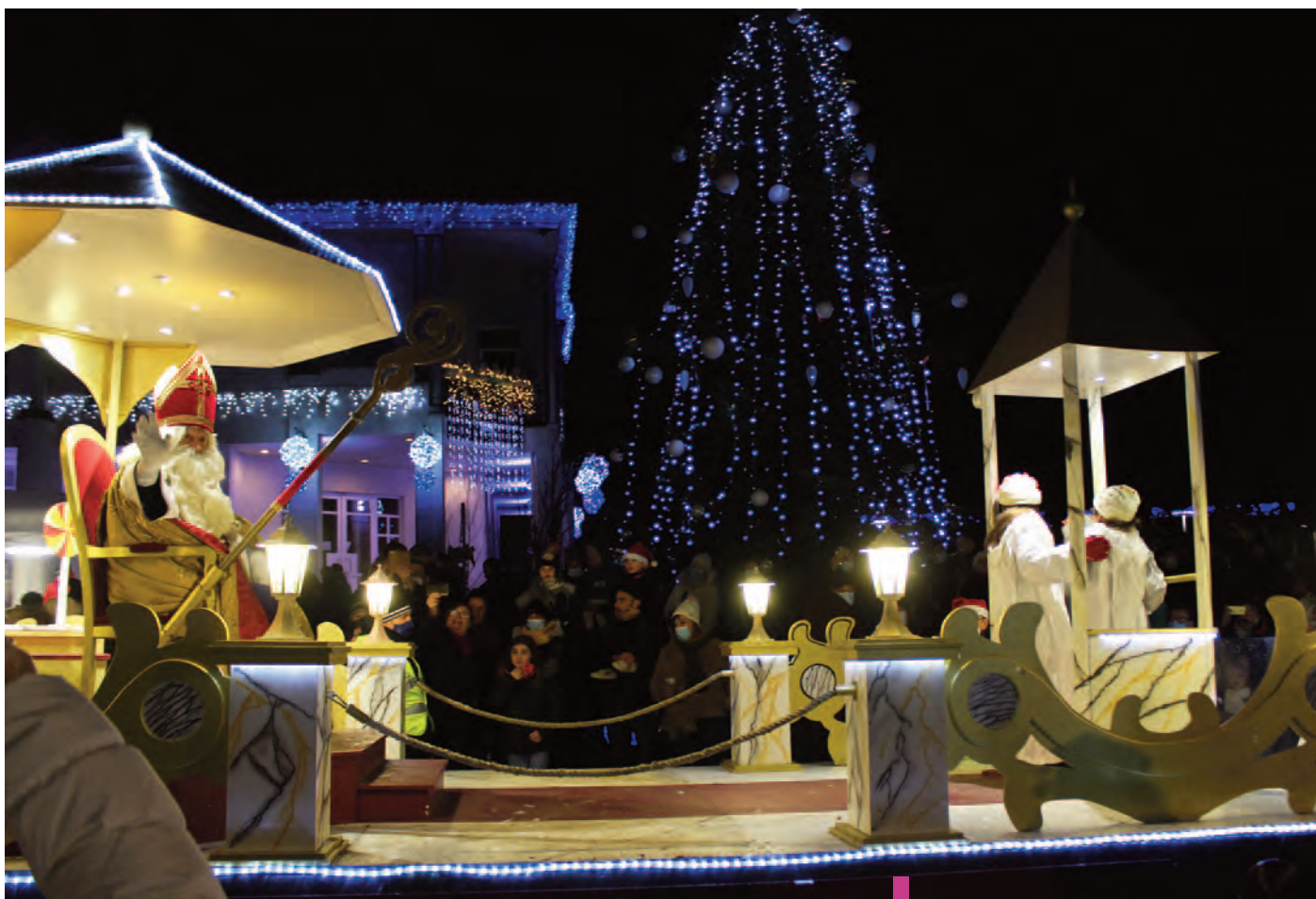
Le thème du défilé sera cette année : le verre.

Cette année encore, la Ville de Ludres fera vivre à chacun la magie de la Saint-Nicolas ! En lien avec ses partenaires*, elle s'est mobilisée pour vous offrir un programme familial, chaleureux et solidaire. Les festivités débiteront le 3 décembre et feront, à coup sûr, briller les yeux des petits et des grands.