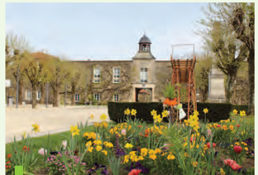
Les massifs Place Ferri de Ludre font référence au patrimoine minier de la commune.

Noms de plusieurs bâtiments municipaux, choix des couleurs pour le fleurissement... À Ludres, les clins d'œil et les références à l'identité et au patrimoine sont nombreux. Vous pouvez aller à la résidence autonomie Les Fougères pour rendre visite à l'un de vos proches. Votre/vos enfant(s) fréquente(nt) peut-être le multi-accueil Les Primevères et vous avez peut-être déjà franchi les portes de l'espace Séquoia pour pratiquer une activité sportive ou un loisir. L'histoire, elle, est une source d'inspiration pour les jardiniers municipaux. Le choix de couleurs rouges-orangées rappelle les anciennes mines de fer, la présence de pieds de vigne évoque l'activité viticole qui fut jadis pratiquée tandis que le paillage, les murs en pierres sèches et les agréments dans certaines compositions font référence au calcaire foisonnant sur le site de La Castine.