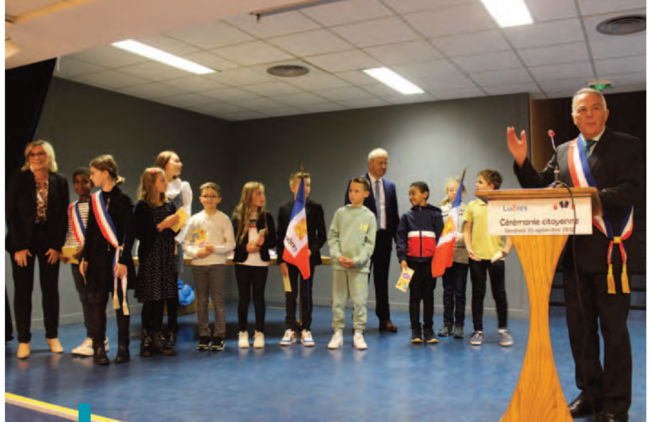
À l'issue de la cérémonie, tous les enfants du CME ont reçu un livret du jeune citoyen.