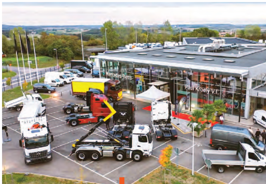
La concession est située dans le secteur du Franclos.

Auparavant scindées, les activités poids-lourds et utilitaires étaient respectivement localisées à Richardménil et Laxou. « C'est en 2013, grâce à une opportunité foncière, que nous avons pu rassembler les deux concessions sur ce même site, très fonctionnel pour notre clientèle », complète le directeur.