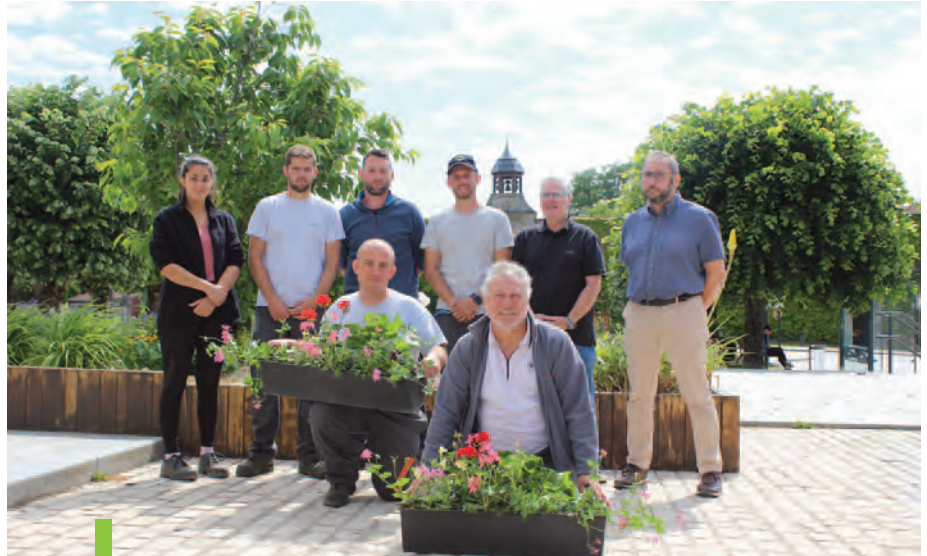
Le Service des Espaces verts œuvre tout au long de l'année à l'embellissement de la Ville.

• Pour retarder autant que faire se peut la coupe mécanique de la végétation à certains endroits et préserver la biodi-