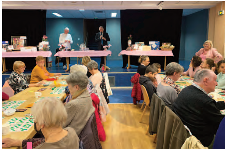
Loto organisé salle Monnet : les lots offerts par les commerçants ont permis d'abonder la cagnotte d'Octobre Rose.

Tout au long du mois d'octobre, le Centre Communal d'Action Sociale (CCAS) et la Ville se sont mobilisés aux côtés de la Ligue contre le cancer pour soutenir la recherche médicale et rappeler l'importance du dépistage du cancer du sein. Au programme : vente par les enfants du CME et les bénévoles du CCAS de sacs de course et de pâtisseries préparées et offertes par la boulangerie Sékolène et Nicolas , concert de l'École de Musique, loto doté par les commerçants ludréens, chorégraphie collective à l'Espace Sequoia. Ces animations, ajoutées à la vente de douceurs dans les boulangeries Choné et Lintingre , ont permis de collecter 1 500 €, recette qui sera intégralement reversée au Comité Départemental de la Ligue contre le cancer.