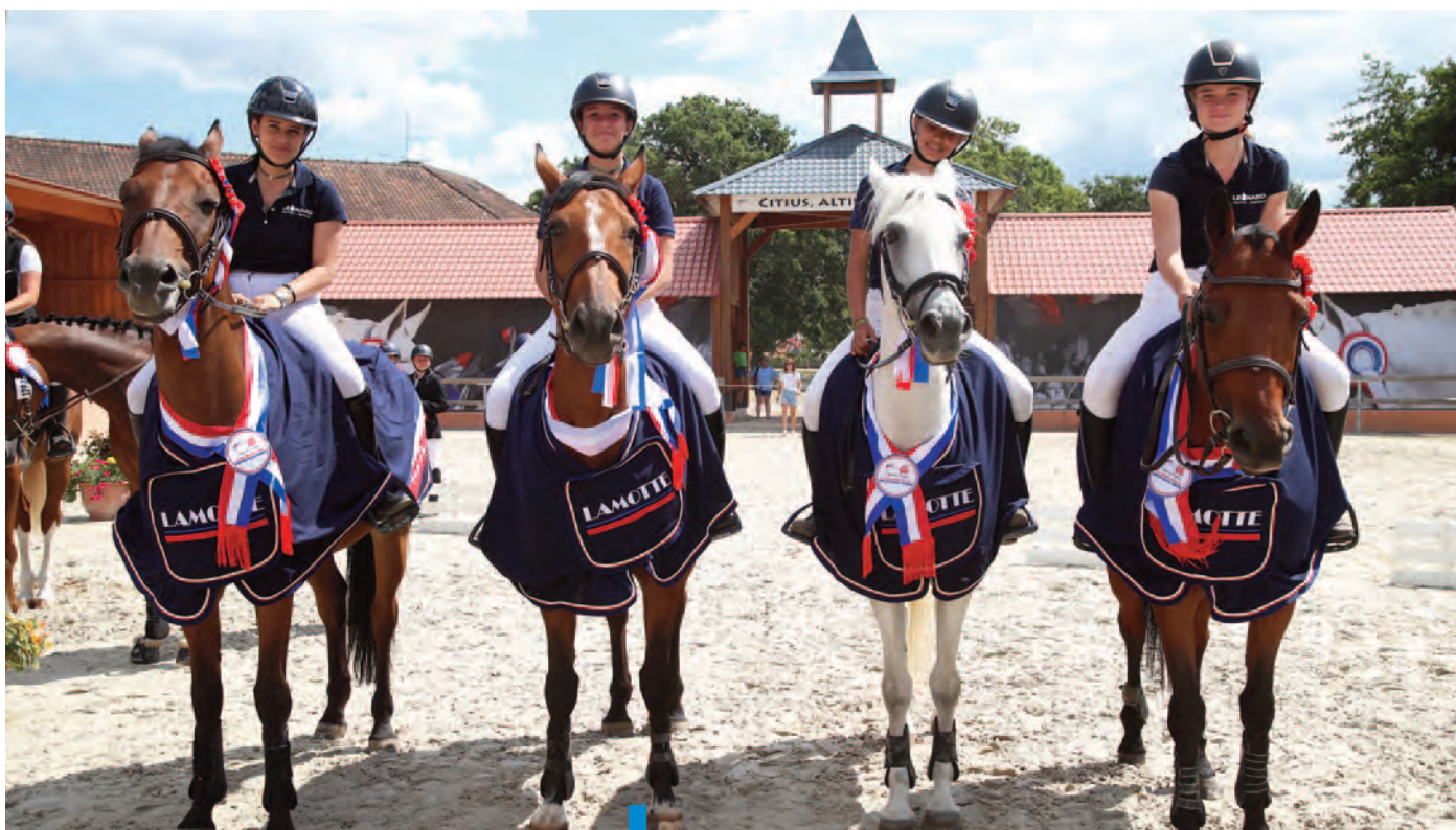
L'équipe sacrée Championne de France aux derniers Championnats de saut d'obstacles.