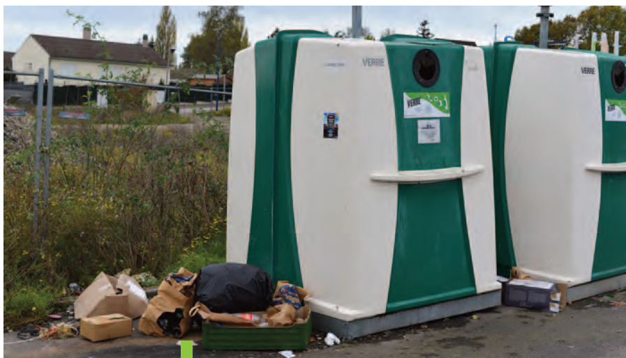
Ne pas confondre Point d'Apport Volontaire et lieu de dépôt sauvage !

On n'a jamais autant parlé d'environnement. Mais alors que les collectivités locales se mobilisent pour améliorer la gestion des déchets et que les citoyens s'emploient à mieux trier pour moins jeter, il faut le reconnaître, les dépôts sauvages se multiplient et pas seulement loin des regards... Une problématique qui nous concerne tous !