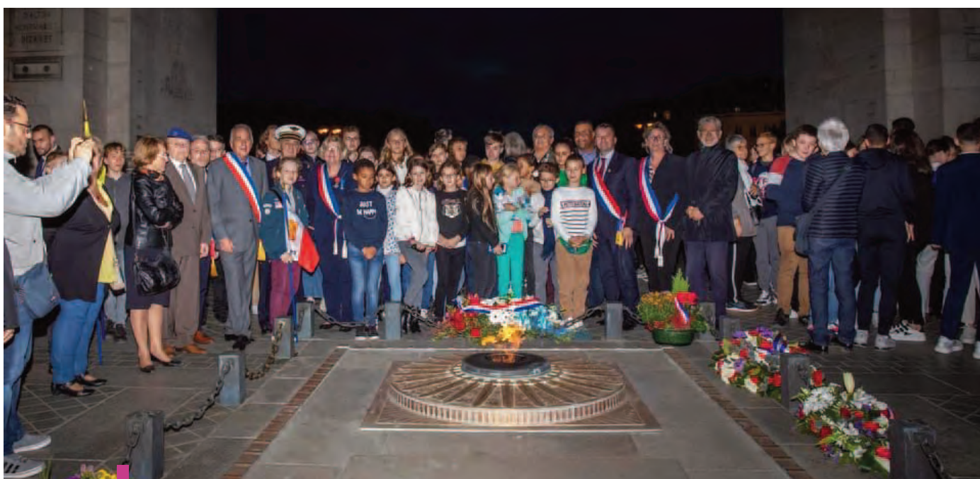
La délégation a terminé cette journée mémorielle par la cérémonie du ravivage de la flamme du Soldat inconnu à l'Arc de Triomphe.