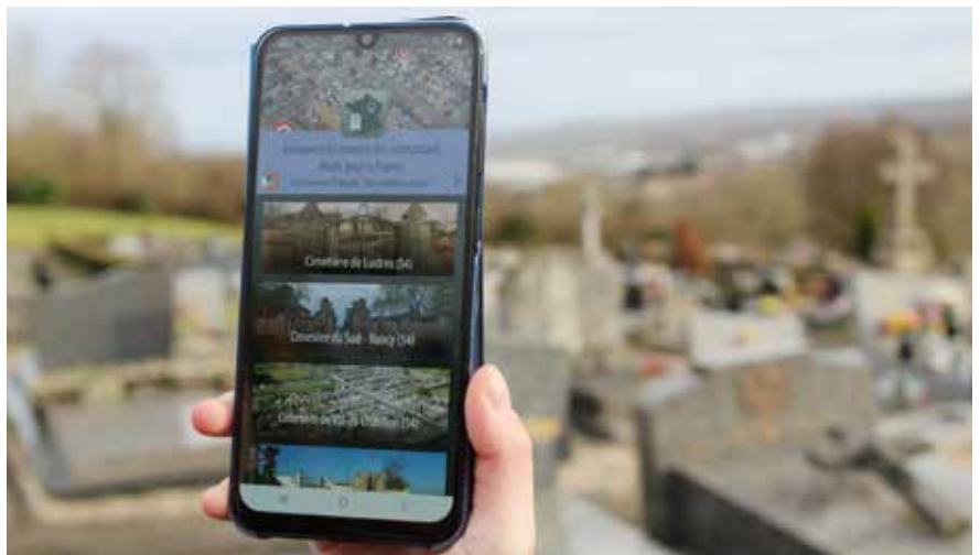
L'application Géomémoire est disponible sur Google Play et l'App Store.

Dès le printemps, l'application pour smartphones Géomémoire sera active et vous donnera accès à de nombreux documents d'archives sur les 5 soldats ludréens morts pour la France et inhumés au cimetière. Un QR Code va être affiché à l'entrée du cimetière pour vous permettre de télécharger facilement l'application. Après avoir géolocalisé leurs tombes, vous pourrez découvrir la vie de ces combattants en accédant à leurs fiches biographiques, à des photos, des lettres d'époque ou encore à des enregistrements vocaux (réalisés par les jeunes du Conseil Municipal des Enfants -CME- dans le studio de l'École de Musique). Afin de mettre en œuvre ce projet et de proposer Géomémoire , la Ville s'est associée au Souvenir Français , et les fiches détaillées ont été préparées par les enfants du CME accompagnés de Sophie Mercier, adjointe déléguée à la Jeunesse, avec l'appui du Cercle d'Études Locales et d'Olivier Petit, historien.