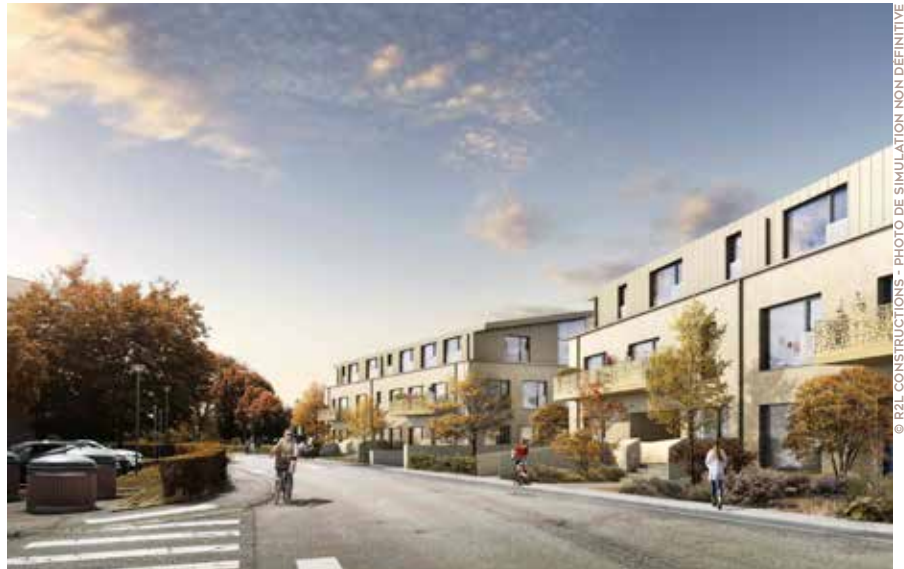
Situées au cœur du village, ces résidences s'inséreront parfaitement dans la continuité paysagère du quartier.

Projet structurant pour Ludres, la reconversion des bâtiments de l'ancien Centre Brassens, situés rue de Secours, est désormais engagée par la société R2L Constructions qui s'est portée acquéreur. Deux résidences vont sortir de terre d'ici 2026, apportant une réponse à la forte demande de logements dans la commune. Aperçu sur ce programme.