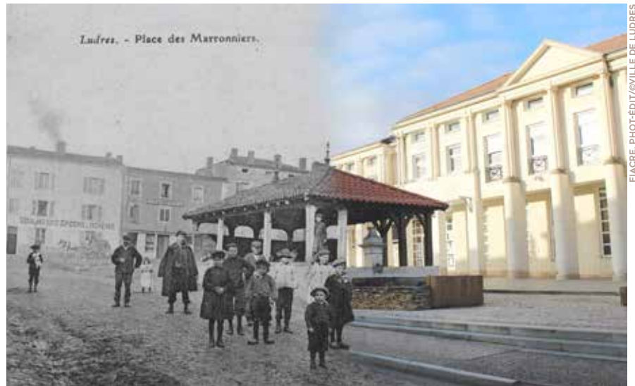
L'abri au-dessus du lavoir a été construit en 1844.