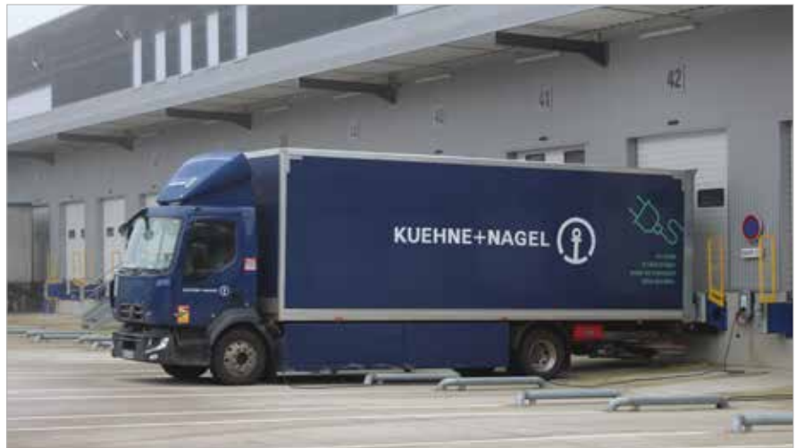
L'agence ludréenne Kuehne+Nagel possède plusieurs porteurs électriques participant à réduire leur empreinte environnementale.

Kuehne+Nagel à Ludres, l'agence du géant mondial du transport et de la logistique, joue un rôle clé dans la gestion des chaînes d'approvisionnement du Grand Est. Avec son expertise en matière de transport, elle soutient l'engagement du groupe vers une logistique efficace et plus durable. Présentation.