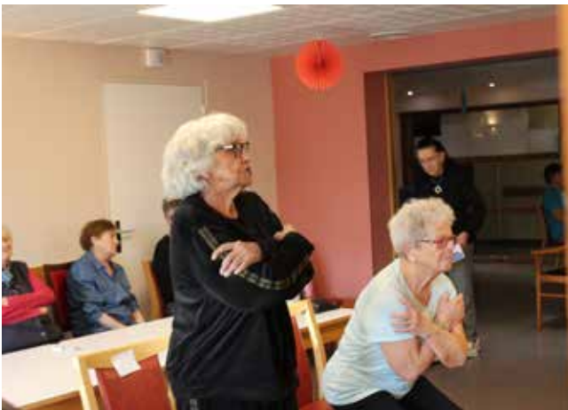
Ces ateliers se déroulent à la résidence autonomie Les Fougères et sont placés sous le signe de la convivialité.