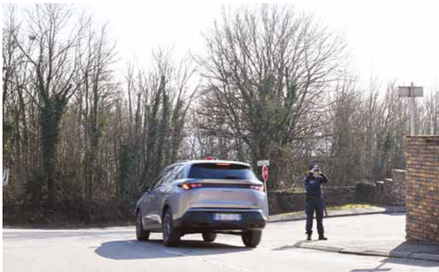
Des contrôles de vitesse sont réalisés pour inciter les usagers du Plateau des Loisirs à lever le pied au nom de la sécurité de tous.

On estime qu'un conducteur sur deux roule régulièrement au-delà de la vitesse autorisée. Un comportement qui, à côté des risques générés pour soi-même, peut très vite s'accompagner d'une mise en danger d'autrui. Ludres n'est pas épargnée, le secteur sensible est l'accès au Plateau.