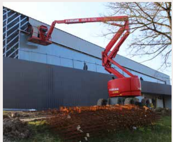
La réhabilitation des extérieurs s'achèvera en avril.

Les différentes étapes de ce chantier d'envergure se déroulent selon le planning prévisionnel élaboré par l'architecte maître d'œuvre, en lien avec la Ville. « La réhabilitation des extérieurs et du cheminement va prochainement s'achever. En parallèle, les entreprises œuvrent sur les autres espaces avec une priorisation du gymnase et des vestiaires afin que les élèves du collège puissent y reprendre une activité sportive en octobre », précise l' élu.