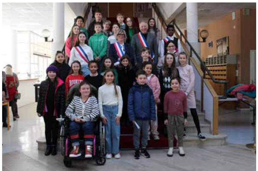
La nouvelle assemblée est composée de 20 enfants élus et 9 tuteurs.

prochain, ils assisteront à leur premier Conseil municipal au cours duquel ils désigneront leur maire.