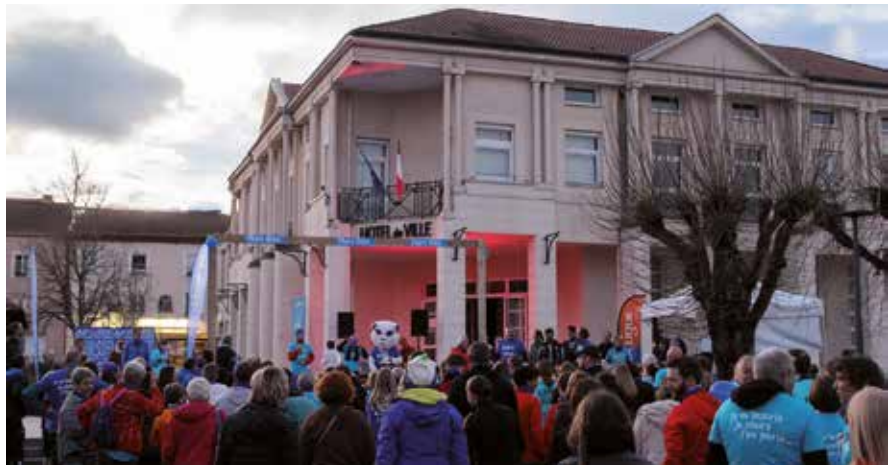
Le 28 mars en soirée, joignez-vous au défilé convivial dans les rues du village : chaque tour bouclé permettra de verser 1 € au profit de la recherche contre le cancer grâce à un laboratoire partenaire.

En ligne avec la politique de santé et de prévention par le sport, conduite par la Ville, Mars Bleu s'invite cette année en classe pour une sensibilisation des scolaires aux bienfaits de l'activité physique, avant une mise en pratique en famille lors de la course populaire du 28 mars au départ de la place Ferri.