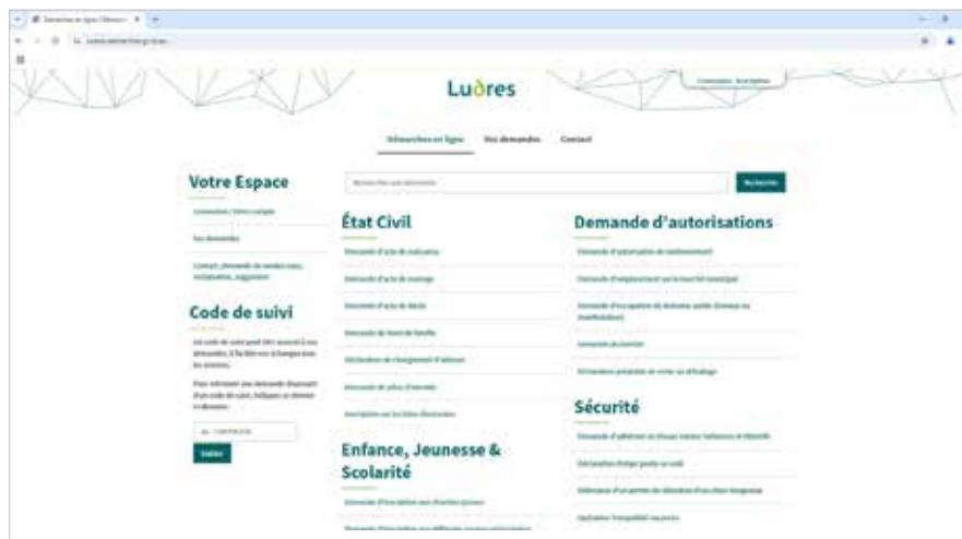
La GRC donne aux Ludréennes et Ludréens la possibilité d'effectuer leurs démarches directement en ligne.

Cette nouveauté donne la possibilité à chacun d'effectuer ses démarches directement en ligne, depuis son ordinateur ou son smartphone.