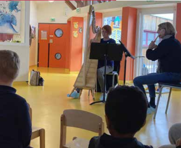
Les professeurs de l'École de Musique animeront un temps de jeu autour de la musique.