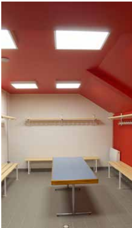
Désormais, les vestiaires répondent aux spécificités liées à la réglementation de la Fédération Française de Football.