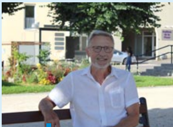
Claude Coach propose de vous accompagner gratuitement dans votre pratique sportive.

Ce service de coaching vient en complément des séances gratuites d'initiation au sport proposées par