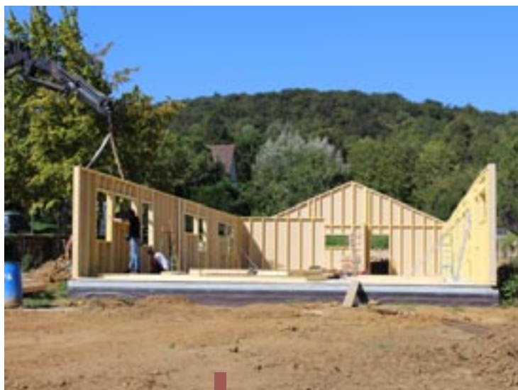
Les murs ont été montés début septembre.

Depuis le mois de juillet, des travaux sont menés rue de Secours. Le projet, porté par la société SDBI construction bois, verra une maison des médecins ouvrir ses portes au printemps 2024. Comptant 6 cellules, elle accueillera 6 médecins-généralistes dont ceux exerçant actuellement rue Debussy. À l'horizon 2025, une maison des dentistes sera aménagée sur le même espace pour accueillir 4 dentistes et un prothésiste dentaire, dont les 2 installés rue Debussy. Situé à proximité du cœur de ville, ce projet sanitaire intègre également la création d'une trentaine de places de stationnement dédiées aux professionnels et aux patients. « L'offre de soins est un gage de la qualité de vie, c'est pourquoi », explique Xavier Dussault, adjoint délégué à l'urbanisme, « nous avons accompagné la mise en œuvre de ce projet en cédant du foncier. »