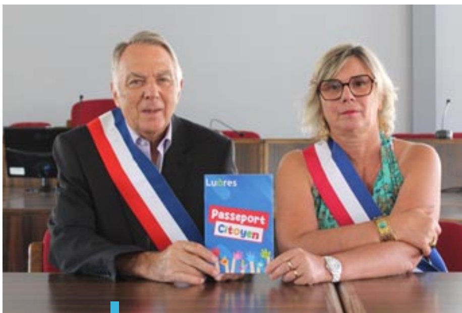
Avec ce passeport, les élus souhaitent éveiller les jeunes à la citoyenneté.

Pour sensibiliser les jeunes Ludréens âgés de 8 à 18 ans à la citoyenneté et aux valeurs de la République, la Ville a mis en œuvre un nouveau dispositif : le Passeport citoyen. Informatif et ludique, il invite les jeunes à s'impliquer dans la vie locale.