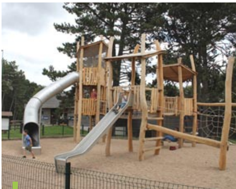
La nouvelle aire de jeux amuse déjà les petits !

Toute belle, toute neuve ! La nouvelle aire de jeux du Plateau des Loisirs est sortie de terre au cours de l'été. Elle offre une structure composée de 3 parties, chacune adaptée à une tranche d'âges pour les enfants allant de 4 à 16 ans. Des parcours d'obstacles, des tours, des toboggans ou encore un « pont de singe », tout a été conçu pour amuser les petits de façon sécurisée. Cette aire de 280 m 2 , construite sur mesure à base de matériaux exclusivement naturels, s'intègre parfaitement au décor verdoyant du Plateau des Loisirs. La fin des travaux, prévue au départ pour le début de l'année, a été finalement décalée par le fabricant en raison de contraintes d'ordre logistique. Ce remplacement de l'aire de jeux intervient dans le cadre du programme pluriannuel de rénovation des aires de jeux débuté en 2018, qui a pour objectif de garantir la sécurité des jeunes usagers. Ces nouveaux jeux ont su trouver leur public !