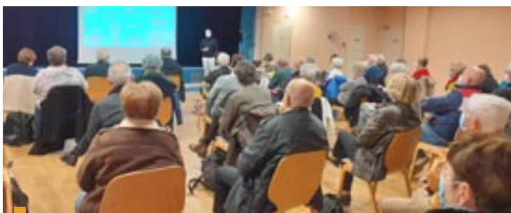
En 2022, un atelier numérique avait déjà eu lieu en salle Jean Monnet, sous la houlette du conseiller numérique France Service.

Tél. : 06 73 65 30 37 - conseilernumerique54@gmail.com