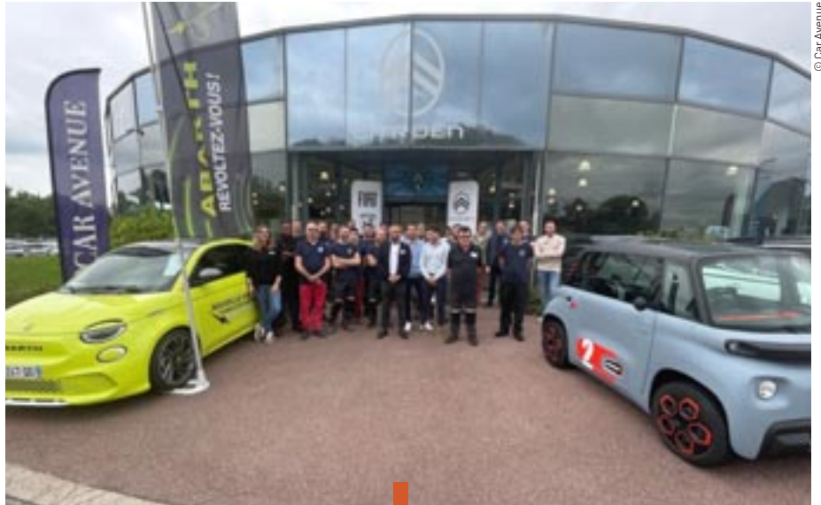
La concession se situe à l'entrée nord de la ville.

Depuis le début de l'année, les concessions Citroën et DS Automobiles du Groupe automobile CAR Avenue, situées à l'entrée nord de la Ville, ont évolué en un pôle automobile multimarques. Regroupant dorénavant six marques du constructeur Stellantis, ce site dédié à la mobilité est le seul de la Métropole à proposer une offre aussi complète sous le même toit.