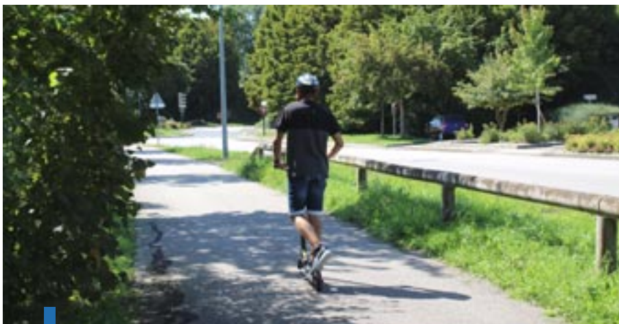
Les trottinettes électriques fleurissent aux quatre coins de la ville depuis quelques années.

Pour que chacun puisse circuler aisément et de façon sécurisée, il est important de connaître les réglementations en vigueur. Un utilisateur de trottinette sans moteur est considéré comme un piéton. Il est donc invité à se déplacer sur le trottoir, à respecter les feux tricolores destinés aux piétons et à rouler à une allure modérée (6 km/h maximum). Pour ce qui est des engins à moteur, c'est un peu plus compliqué. Avec l'augmentation des utilisateurs de trottinettes électriques, un nouveau plan national de régulation des Engins de déplacements personnels motorisés