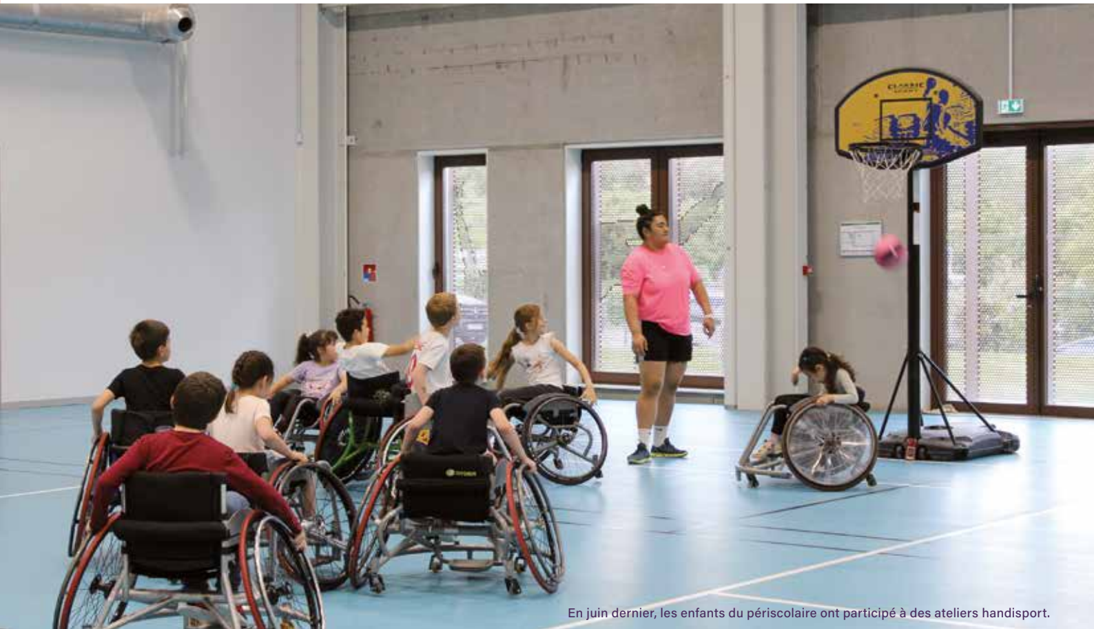
En juin dernier, les enfants du périscolaire ont participé à des ateliers handisport.