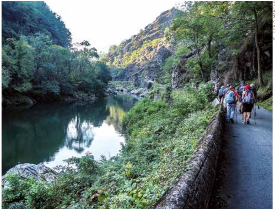
En 2023, Ludres Marche avait consacré sa semaine de randonnée annuelle à la découverte du Pays Basque.