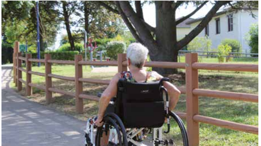
La ville s'attache à rendre les bâtiments accessibles. La voirie est quant à elle de la compétence de la Métropole via la Commission intercommunale d'accessibilité.

Depuis le début des années 2000, la Ville travaille à garantir l'accessibilité de ses bâtiments et services afin de les rendre conformes et plus pratiques pour tous. Les transformations du paysage urbain et des dispositifs favorisent l'inclusion sociale tout en permettant aux personnes vulnérables de gagner en autonomie.