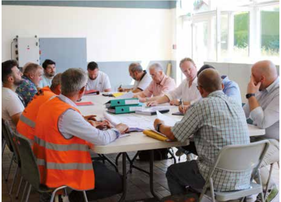
La première réunion de chantier a marqué le lancement des travaux.

Les entreprises ont récemment investi le chantier du gymnase Marie Marvingt. Même si, pour le moment, les travaux ne sont pas très visibles, ils ont nécessité d'importants préparatifs. En effet, il a fallu aménager et sécuriser la zone de chantier mais surtout reloger les associations et les clubs sportifs afin qu'ils puissent maintenir leurs activités.