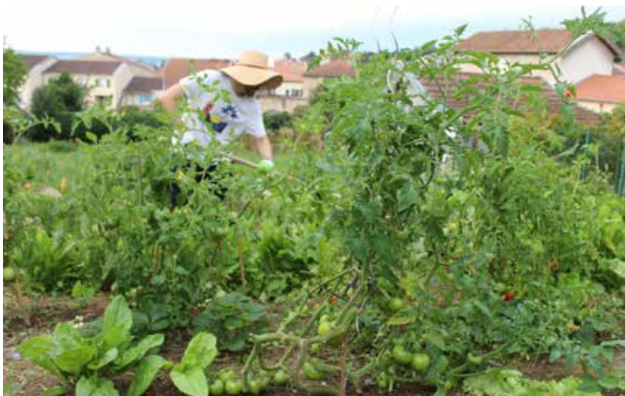
Les jardiniers s'en donnent à cœur joie dans ce potager.

Depuis le 9 avril, la Ville met à disposition des Ludréennes et Ludréens un potager partagé, près du Parc Grandjean, au centre du village. Fractionnés en 16 parcelles cultivables, de 50 m 2 chacune, ces terrains offrent aux jardiniers amateurs (ou confirmés) la possibilité de cultiver leurs fruits et légumes ou de planter leurs fleurs dans un espace adapté. Certains « jardiniers-locataires » n'ont pas tardé à faire fructifier leur terre, et ce qui est sûr, c'est qu'ils ont la main verte ! Tomates, courgettes ou encore fraises foisonnent déjà de part et d'autre du potager. Afin d'entretenir cet espace, les Chantiers Jeunes ont effectué le débroussaillage des mauvaises herbes et divers travaux, en juillet dernier. Si vous souhaitez vous y mettre et vous aussi cultiver votre petit bonheur, ne tardez pas, prenez contact avec la mairie, il ne reste que quelques parcelles... Ne vous faites pas couper l'herbe sous le pied !