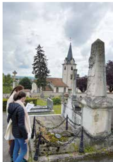
Les jeunes du CME ont recensé les tombes des soldats morts pour la France, au cimetière de Ludres.

Pour étoffer ce travail de mémoire et permettre aux personnes déjà sensibilisées, comme au grand public, d'en apprendre davantage sur l'identité des combattants, la Ville met actuellement en place, aux côtés du Souvenir