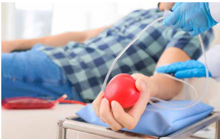
Il est également possible de faire des dons de plasma ou de plaquettes.

Le 18 octobre prochain, l'Établissement Français du Sang (EFS) organisera une collecte à l'Espace Séquoia. Contribuant à soigner les personnes atteintes de maladies chroniques, de cancers ou victimes d'accidents graves, l'acte de donner son sang est un geste solidaire indispensable. Et si vous deveniez donneur ?