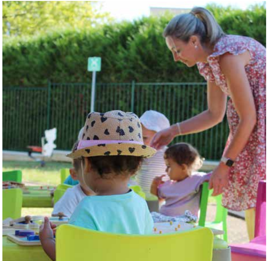
Les petits du multi-accueil profitent régulièrement des espaces extérieurs.