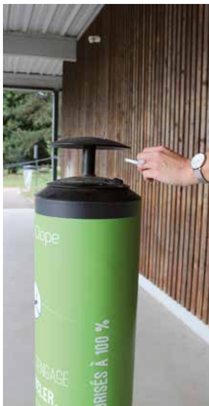
Fumer nuit gravement à la santé.