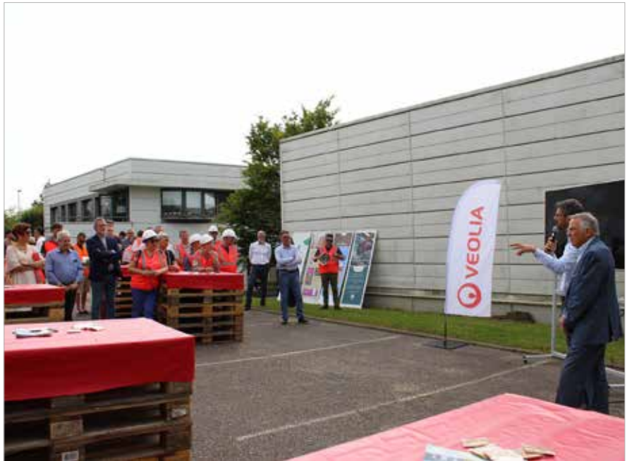
En juin dernier, les équipes Veolia avaient convié chefs d'entreprise du Dynapôle et élus métropolitains à l'occasion d'une journée portes ouvertes au centre de tri.

Acteur mondial majeur dans la collecte, le traitement et la valorisation des déchets, Veolia concentre 4 sites d'exploitation sur le Dynapôle. Comptant plus de 240 collaborateurs, ces agences gèrent les déchets produits par les ménages et les professionnels du territoire métropolitain, avec comme mot d'ordre « recycler et valoriser ».