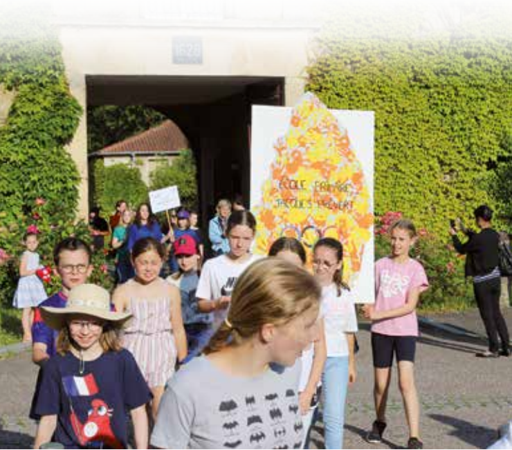
Chaque groupe a présenté sa flamme olympique, confectionnée pour l'occasion.