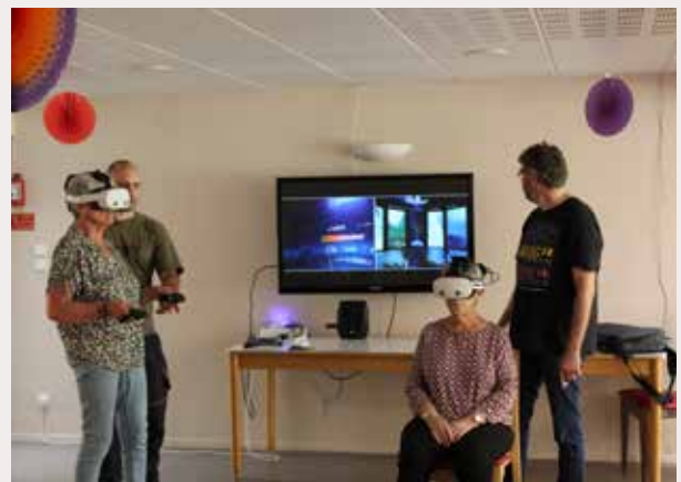
Les résident.e.s sont nombreux.se.s à s'être inscrit.e.s pour participer à cette animation.

En septembre dernier, une quinzaine de seniors de la résidence autonomie Les Fougères ont participé à une parenthèse hors du temps lors d'un atelier de réalité virtuelle. Organisée par le Centre Communal d'Action Sociale (CCAS) en partenariat avec l'entreprise ludrénienne Guardian of Real , cette animation a permis aux résidents de voyager dans différents lieux, aussi variés que dépaysants. Casque sur la tête, manettes en mains, chacun a pu observer des animaux sauvages en pleine savane, flotter dans l'immensité de l'espace, se promener en forêt ou découvrir la cathédrale Notre-Dame de Paris lors de sa construction, au XII e siècle. Les plus curieux ont même testé Beat Saber , un jeu musical où il faut trancher des blocs colorés au rythme de la musique, un défi à la fois énergique et amusant. Si ces expériences procurent d'abord émerveillement et rires, elles offrent aussi des atouts précieux : stimuler la mémoire, éveiller les sens et renforcer la convivialité entre résidents. Avec ce type d'activités, le CCAS enrichit sa palette d'animations proposées aux Fougères . Aux côtés des classiques – gymnastique douce, concerts et repas festifs – la réalité virtuelle trouve désormais sa place comme un rendez-vous attendu, alliant innovation, plaisir et lien social.