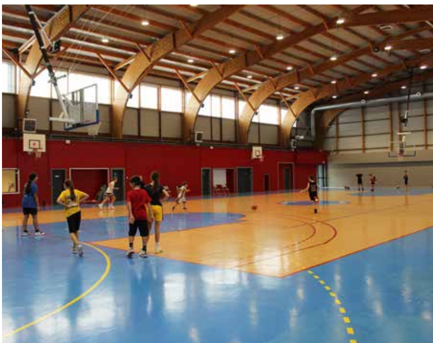
Depuis cet automne, les sportifs ont réinvesti le gymnase.

Représentant un investissement financier non négligeable de 4 M d'€, cette réhabilitation a bénéficié du soutien financier de plusieurs partenaires publics, mobilisés par la Ville afin de préserver l'équilibre de ses finances. L'État a ainsi participé à hauteur de 500 000 € en lien avec le fond Vert, le Conseil départemental a financé 400 000 € dans le cadre de l'appui aux territoires, la Région a versé 260 000 € au titre du soutien à l'amélioration du cadre de vie. L'Europe a, elle aussi, été sollicitée dans le cadre de son programme FEDER.