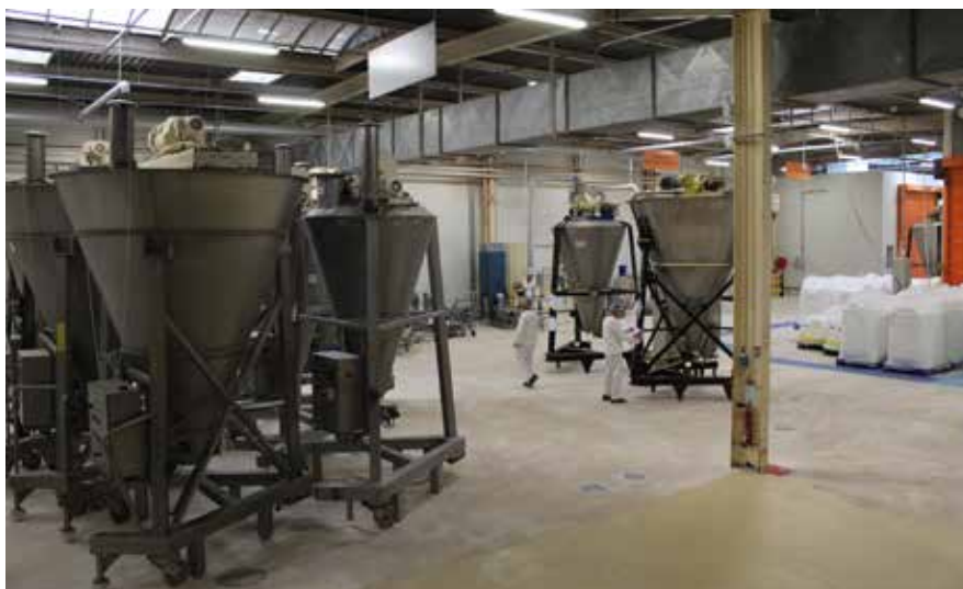
Les recettes sont préparées dans de grands mélangeurs avant d'être conditionnées.

Employant 82 salariés et développant pas moins de 450 recettes, le site de production de préparations pour desserts Princes France , anciennement Alsa , se positionne comme l'atout « savoir-faire sucré » du groupe italien NewPrinces . Ludres MAG vous propose une visite de cette entreprise emblématique du territoire.