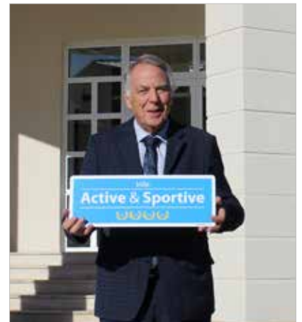
Lors de la cérémonie, les élus ont reçu le panneau dédié, véritable signe distinctif.

Pour une commune d'environ 6 000 habitants, Ludres se démarque par la diversité et la qualité de ses infrastructures : City Stade, terrains de football, skatepark, VTT Park, courts de tennis, salles de sport... mais aussi par son soutien à la vie associative, comme avec les événements Je me bouge, je découvre, je m'inscris , les Trophées des Sports ... ou encore par