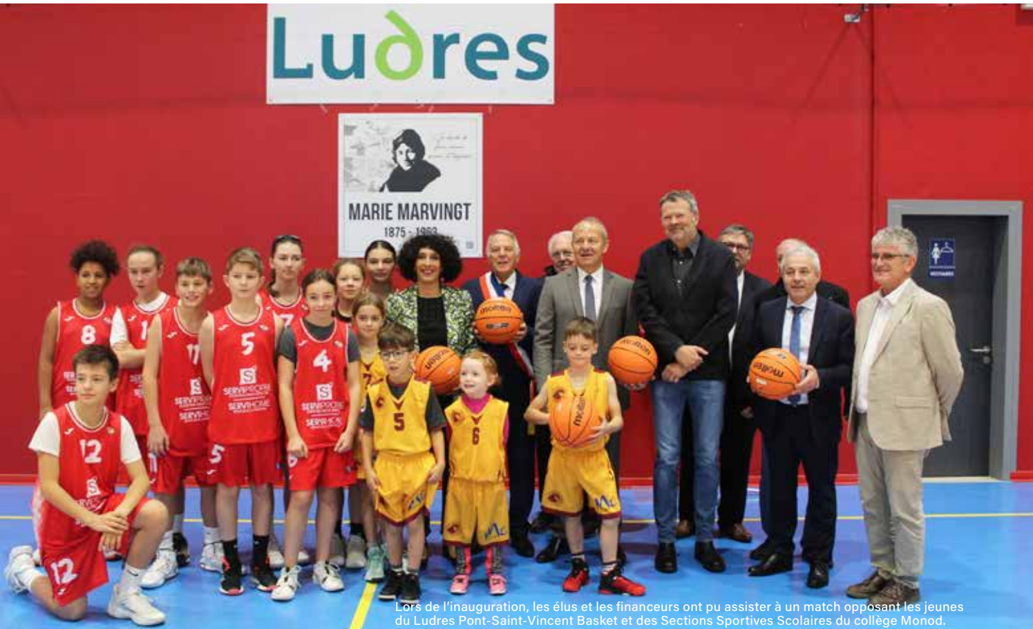
Lors de l'inauguration, les élus et les financeurs ont pu assister à un match opposant les jeunes du Ludres Pont-Saint-Vincent Basket et des Sections Sportives Scolaires du collège Monod.