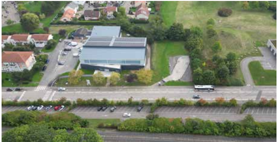
Avec l'installation des panneaux photovoltaïques, le bâtiment est désormais autonome en consommation énergétique.

En initiant ces travaux sur le Gymnase Marie Marvingt, en 2024, la volonté de l'équipe municipale était de faire de ce chantier de rénovation et d'extension un modèle de performance environnementale et thermique.