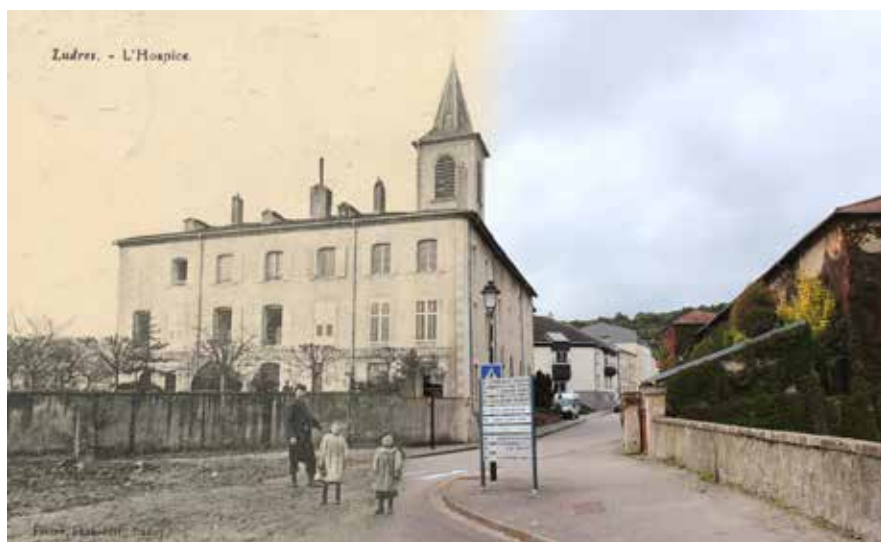
L'hospice, aujourd'hui EHPAD, est une institution de la Ville.

Ludres MAG, en partenariat avec le Cercle d'Études Locales, vous invite à découvrir ce site emblématique de la ville.