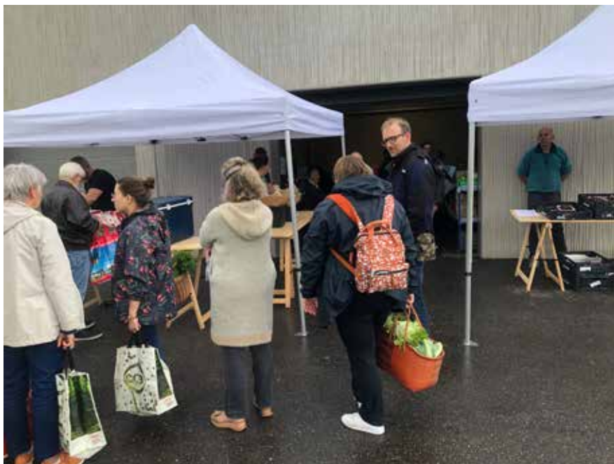
Chaque vendredi, les adhérents récupèrent leur panier dans une ambiance conviviale.

Aujourd'hui âgée de 15 ans, l'Association Ludréenne pour le Maintien d'une Agriculture Paysanne (AMAP) Phacélie permet à une soixantaine de familles de mettre du sens dans leur assiette tout en ayant une consommation locale, issue de l'agriculture biologique et de saison. Zoom sur cette communauté engagée et solidaire.