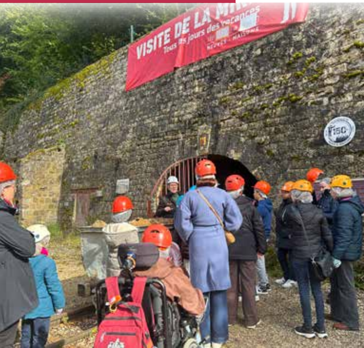
Les jeunes étaient très attentifs lors de la visite.