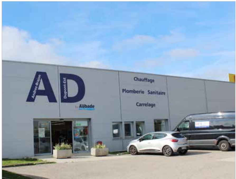
AD by Aubade, à Ludres, s'adresse également aux particuliers à la recherche de matériaux de qualité.

Implanté depuis vingt ans sur le Dynapôle, AD by Aubade s'impose comme un acteur incontournable dans la distribution de matériel électrique, sanitaire, chauffage, plomberie, ventilation ou encore photovoltaïque. Derrière cette enseigne, une longue histoire et une équipe de passionnés au service des artisans du Grand Est.