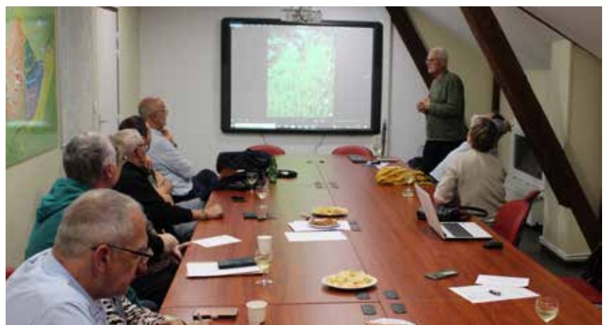
L'agro-écologiste a illustré son propos en diffusant des images.