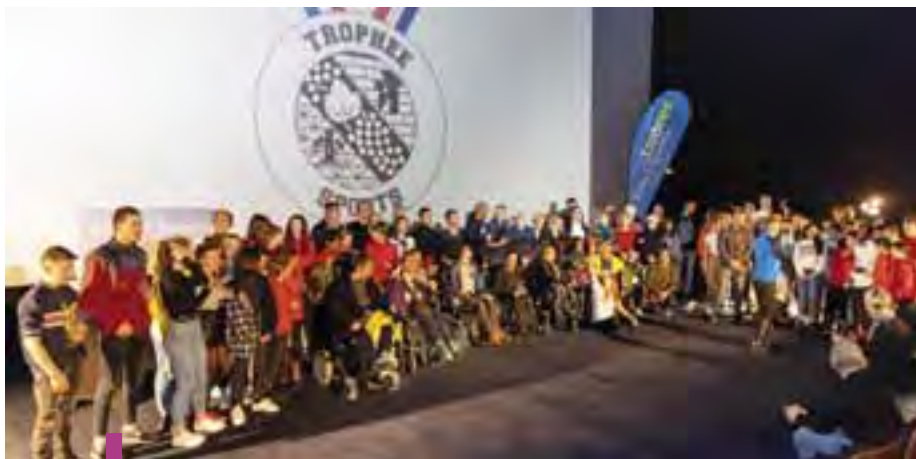
En 2020, l'édition 2019 des Trophées des sports avait récompensé plus de 60 sportifs.

Ainsi, la famille du sport ludréenne se retrouvera pour une soirée conviviale