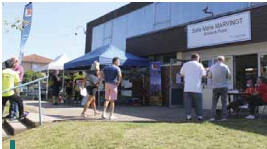
« Je découvre, je me bouge, je m'inscris » a été l'occasion pour les clubs de se retrouver.

P.B. : Nous avons tout fait pour que la vie continue dans le respect des mesures barrières. La crise n'a empêché ni l'organisation des chantiers jeunes, ni la distribution des colis aux personnes âgées. Elle n'a pas non plus interdit les réunions du Conseil Municipal des Enfants ou la mise en place de la démocratie participative.