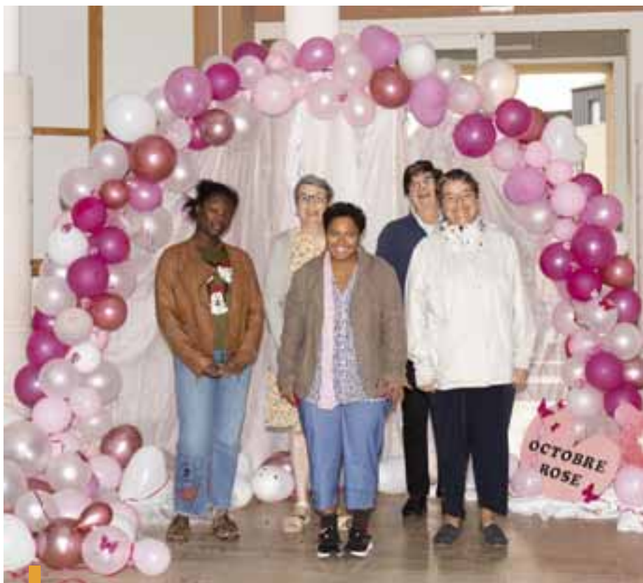
Les résidentes se sont fait photographier pour immortaliser leur participation à Octobre Rose.