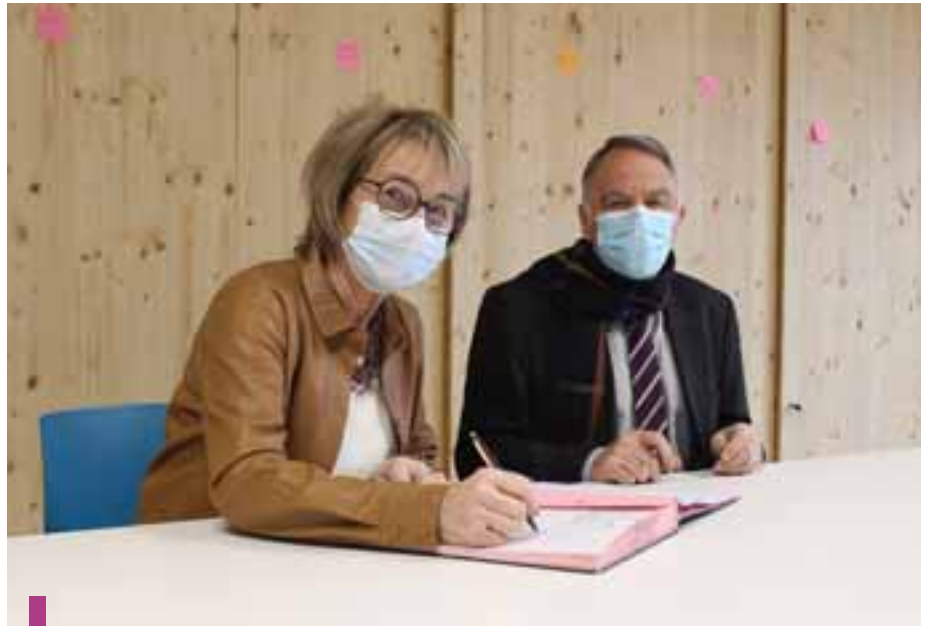
La convention a été signée le 7 décembre, à l’Espace Séquoia.

En contrepartie, la Ville met à disposition de l’association les moyens financiers, matériels et humains, pour lui permettre de fonctionner. Elle définit également le mode d’utilisation de l’Espace Séquoia. D’une surface de 1 935 m 2 , le nouveau