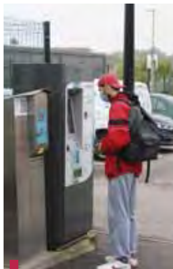
Le distributeur est situé juste avant l'accès au quai.

Saviez-vous que vous pouvez vous rendre en 15 minutes à la gare de Nancy au prix d'un trajet de bus « Stan » ? En effet, sur le territoire de la Métropole, il est possible de voyager en TER avec un titre de transport du réseau Stan.