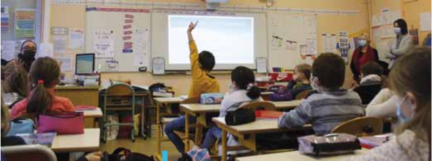
Le Conseil Municipal des Enfants a fait l'objet de présentations interactives dans les écoles.

Le 26 février prochain, de 9h à 12h, près de 300 jeunes Ludréens prendront le chemin des urnes pour la première fois. En effet, ils sont invités à élire le nouveau Conseil Municipal des Enfants (CME) qui succèdera à celui siégeant depuis février 2019.