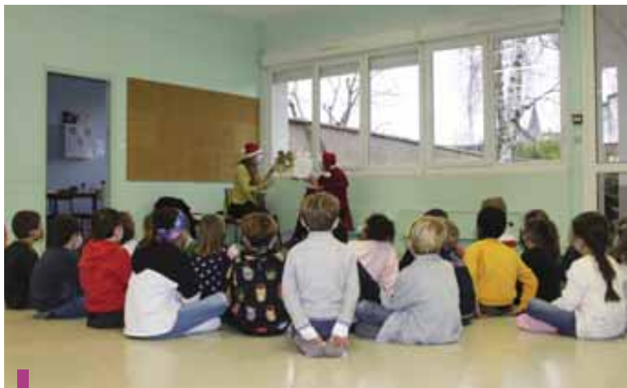
Les bibliothécaires investissent les écoles et émerveillent les enfants. Ici, en période de fin d'année.

CONTACT : 31 place Ferri de Ludre Tél. : 03 83 25 25 50