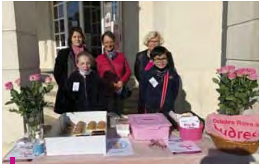
Le Conseil Municipal des Enfants, encadré par le CCAS, a vendu des objets pour Octobre Rose.

Cette année, le programme d'Octobre Rose, initié par le Centre Communal d'Action Sociale, était composé de nombreuses animations variées qui ont permis de collecter des fonds. Les habitants ont répondu favorablement et avec enthousiasme puisqu'ils étaient nombreux à se faire photographier et à savourer les pâtisseries confectionnées par l'ensemble de nos artisans boulangers ludréens. L'exposition à la Médiathèque, le concert de l'École de musique et les stands d'information ont également