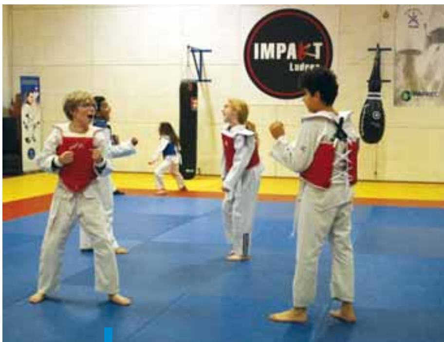
Les enfants s'entraînent les mardis soir à l'espace associatif de Chaudeau.

Maîtriser ses émotions, canaliser son caractère et décharger ses énergies, les bienfaits sont multiples en plus de l'acquisition de réflexes de défense. Pouvant être pratiqué dès l'âge de 7 ans, il participe au développement et à la coordination chez les enfants. « Il contribue également à améliorer leur concentration et cela est important puisque la plupart de nos 40 licenciés sont des enfants », explique Audrey Delalande,