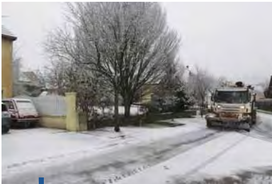
En 2020, avec l'abondance des précipitations neigeuses, les Services techniques n'ont pas ménagé leurs efforts pour rendre les voies de circulation praticables.

Le dispositif de viabilité hivernale se concrétise par la mobilisation de deux équipes de 4 chauffeurs, mobilisées 24h/24, de mi-novembre à mi-mars.