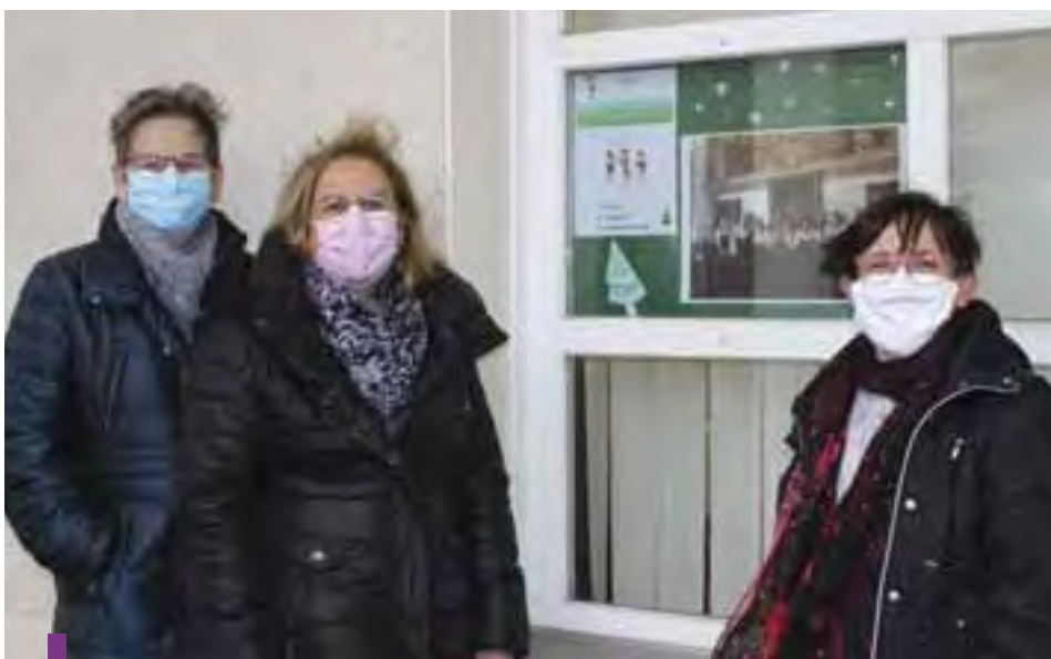
Tout au long du mois, le Comité de jumelage dévoilera une image quotidiennement.

Jusqu’à la fin du mois de décembre, le Comité de jumelage de Ludres propose aux habitants une découverte insolite de nos villes jumelles. Au travers d’un jeu concours ouvert à tous, vous serez transportés à Furth im Wald, Domažlice et Furth bei Göttweig.