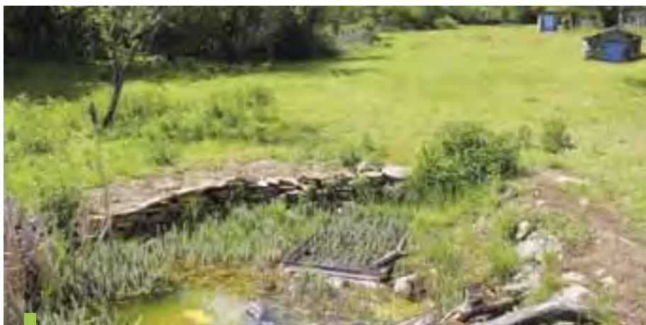
Quatre fosses ont été creusées à Ludres dans le cadre du projet de Trame Biosol : dans les zones humides de la Cuse et du Railleu , à hauteur du jardin pédagogique des coteaux, et à La Castine .

Ludres a ouvert son agenda écologique en réalisant en 2020 un diagnostic interne auprès de ses services. Cette étape a permis de sonder les pratiques des agents municipaux en lien avec le développement durable. Autant de points d'appui naturel pour l'action publique ! Plusieurs initiatives ont suivi. La Ville est à l'origine de la manifestation Faites du vélo , organisée en septembre avec le concours de la Maison du Vélo, des agents de la Police municipale et du club ludréen VTT Évasion , pour faire la promotion des mobilités douces. En lien avec la Métropole du Grand Nancy, elle a soutenu le programme de plantation de haies en lisière du plateau.