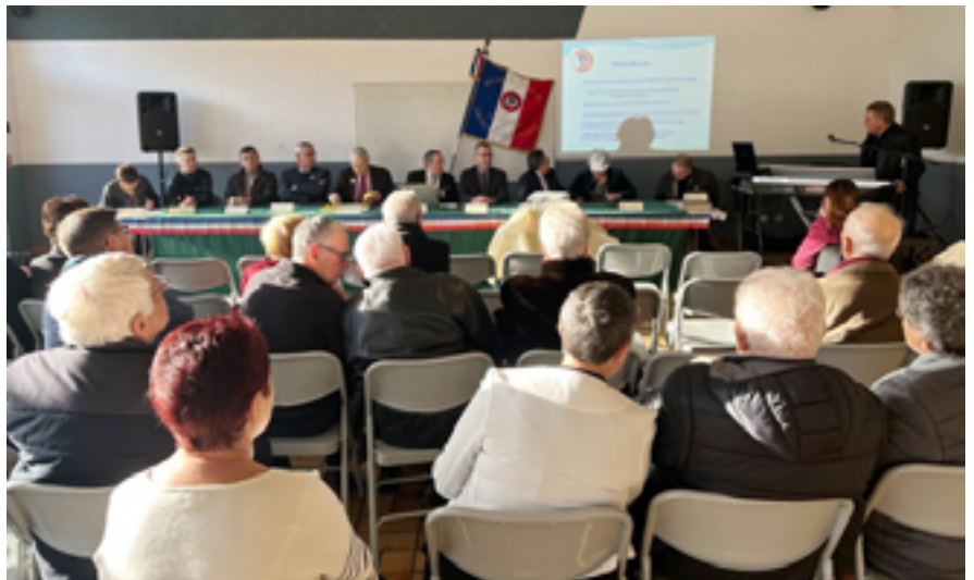
L'assemblée générale du Souvenir Français s'est tenue à Ludres, le 16 décembre dernier.

Depuis sa naissance en 1887, le Souvenir Français œuvre pour sauvegarder la mémoire des soldats morts pour la France, tout en travaillant à transmettre le flambeau aux prochaines générations. Acteur du devoir de mémoire à Ludres, l'association perdure au fil des décennies, sans jamais perdre de vue ses objectifs.