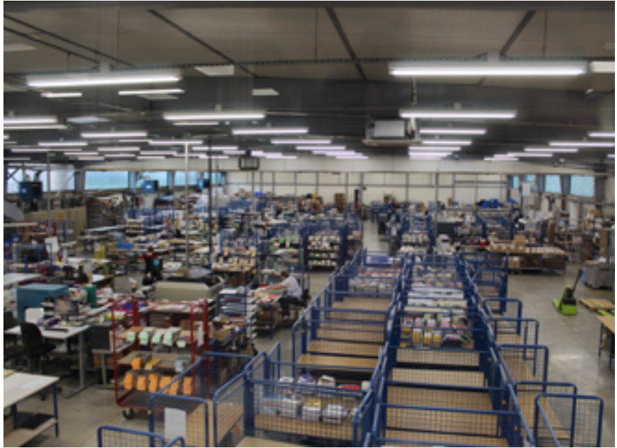
500 000 ouvrages sont traités chaque année par Rénov'Livres .

Depuis 1954, Rénov'Livres donne un coup de baguette magique à l'état de nos petits compagnons à pages. Romans, magazines, bandes dessinées, livres scolaires... Rien n'échappe à l'entreprise, qui continue d'écrire son histoire au fil des pages, à braver les défis d'aujourd'hui tout en proposant de nouveaux services. Coup d'œil à la loupe !