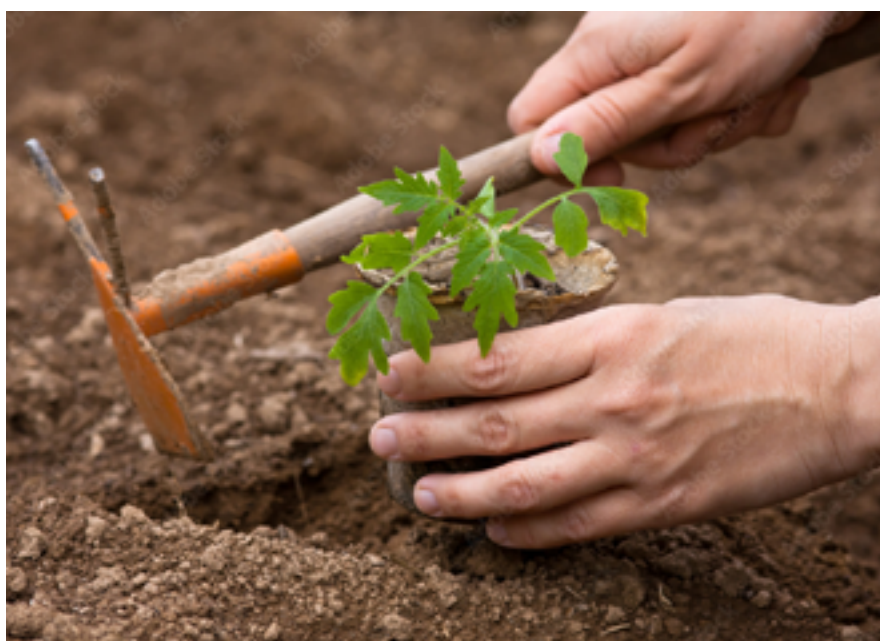
Avec ce projet porté par la Ville, les habitants pourront consommer leur propre production.

CONTACT : 03 83 26 14 33 - mairie@ludres.com