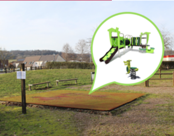
De nouveaux jeux sont en cours d'aménagement à l'aire de jeux Charcot, pour le plus grand plaisir des petits !