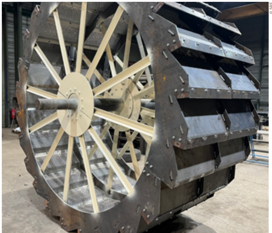
Parmi les projets de l'entreprise figure l'extension de l'atelier pour augmenter ses capacités, nécessaires à la fabrication de pièces imposantes comme cette roue à aubes pour sablière de 2 100 kg.

Située sur le secteur Eiffel du Dynapôle, SRE est une chaudronnerie spécialisée dans la fabrication de pièces en acier et la maintenance industrielle. Misant sur la réactivité, l'expertise et le service apporté à sa clientèle, l'entreprise décroche régulièrement de prestigieux chantiers.