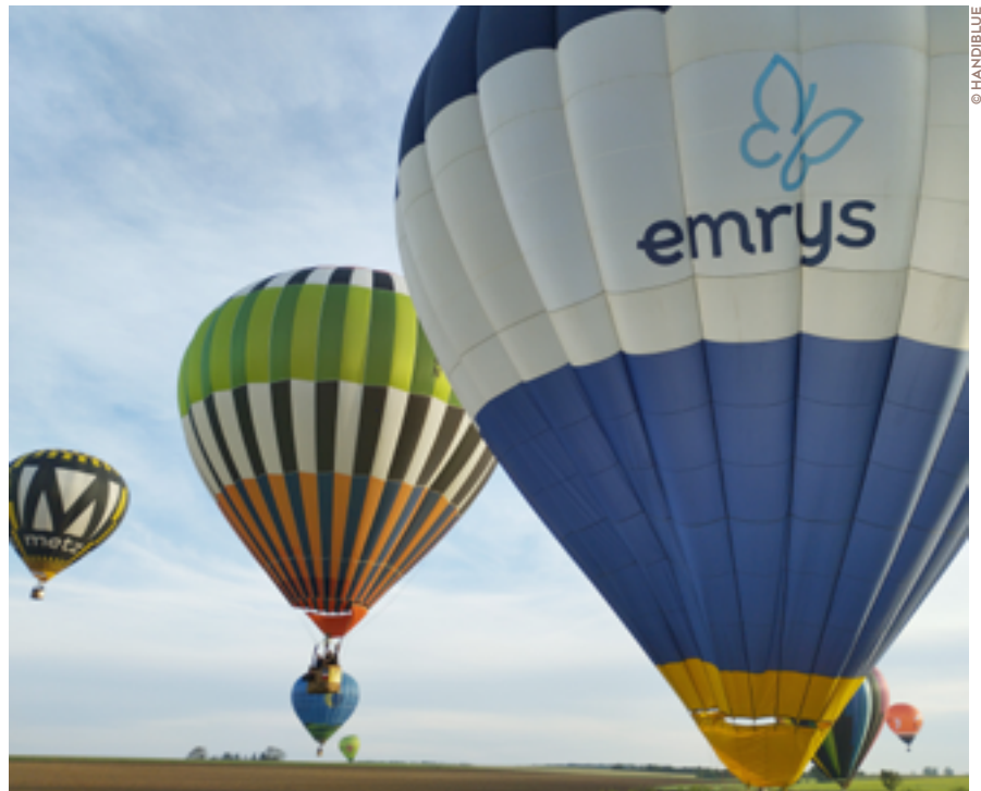
La nacelle de la montgolfière EMRYS d'Handiblu permet un décollage et un atterrissage en toute sécurité.

Ces vols sont rendus possibles grâce aux partenaires et aux mécènes sur lesquels