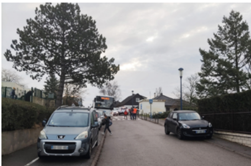
Arrêts inappropriés et stationnement anarchique devant l'école Loti perturbent la circulation et en particulier l'accès des cars scolaires.

Stationnement à cheval sur le trottoir ou devant un garage, arrêt en double file à la sortie de l'école, devant un commerce ou sur un passage piéton... L'occupation illicite de l'espace public n'est jamais sans conséquence, ni sans risque pour soi et pour les autres... La loi sur le sujet est claire : il n'est pas inutile de le rappeler.