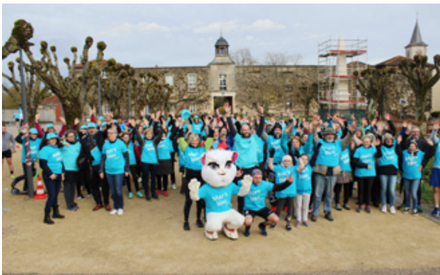
Le 22 mars en soirée, participez à la chaîne humaine et solidaire qui parcourra les rues de la ville. Chaque maillon compte !

Comme les années précédentes, chaque Ludréen pourra, à titre individuel, effectuer un don en ligne sur le site de Mars Bleu et s'inscrire aux deux temps forts du mois : l'Enduro trail « 12 heures contre le cancer », organisé par l'association ludréenne ALTER, le 16 mars sur le Plateau des Loisirs, et le défilé populaire dans les rues de Ludres qui prendra le 22 mars en soirée un virage festif avec animations, place Ferri.