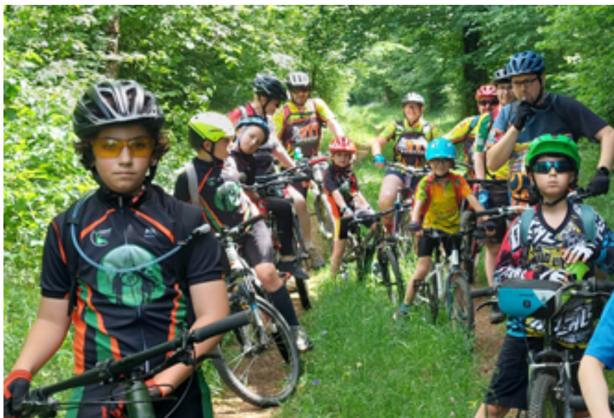
VTT Evasion est reconnue comme la plus grande école du département par la FFCT.

VTT Evasion est assurément un club très actif qui compte un nombre important d'adhérents. Il fêtera ses 20 ans en juillet prochain. Alliant pratique sportive, plaisir, partage et pédagogie, l'association n'a pas fini de faire rider les jeunes et les moins jeunes. Présentation.