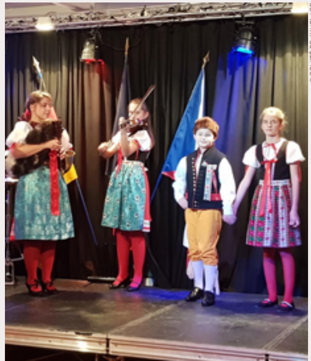
De jeunes musiciens tchèques de l'École de musique de Domažlice, en tenues traditionnelles, à Ludres, en 2019.

Nos voisins européens seront invités à loger chez l'habitant et à visiter Nancy et ses environs afin de partager au mieux notre culture et nos coutumes françaises. Pour poursuivre les réjouissances, un voyage retour est au programme du 26 au 28 avril. L'École de musique et plusieurs Ludréens se rendront en Tchéquie et en Allemagne pour des concerts conviviaux et multiculturels !