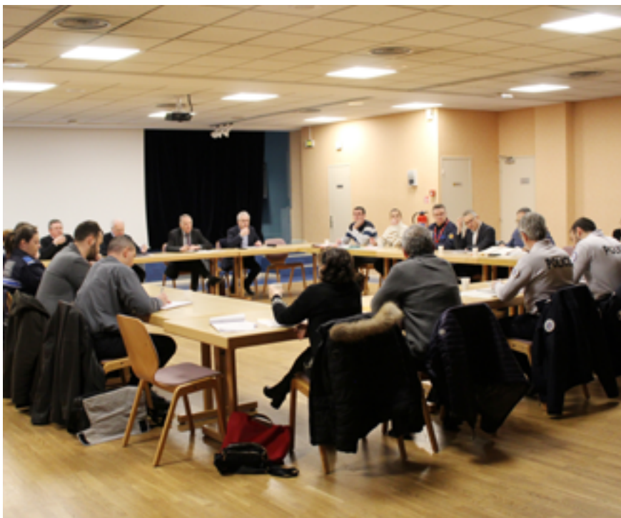
Les partenaires se réunissent régulièrement dans le cadre du CLSI.

Contribuant à la résolution des enquêtes judiciaires en apportant des indices ou des preuves, les caméras de vidéoprotection dans l'espace public présentent également un effet dissuasif dans les cas de violences aux personnes, atteintes aux véhicules, cambriolages et infractions. « C'est pourquoi le Service de Police Municipale de Ludres a récemment réalisé un diagnostic pour déterminer où seraient localisées les 3 caméras qui vont prochainement compléter ce quadrillage territorial », conclut le maire.